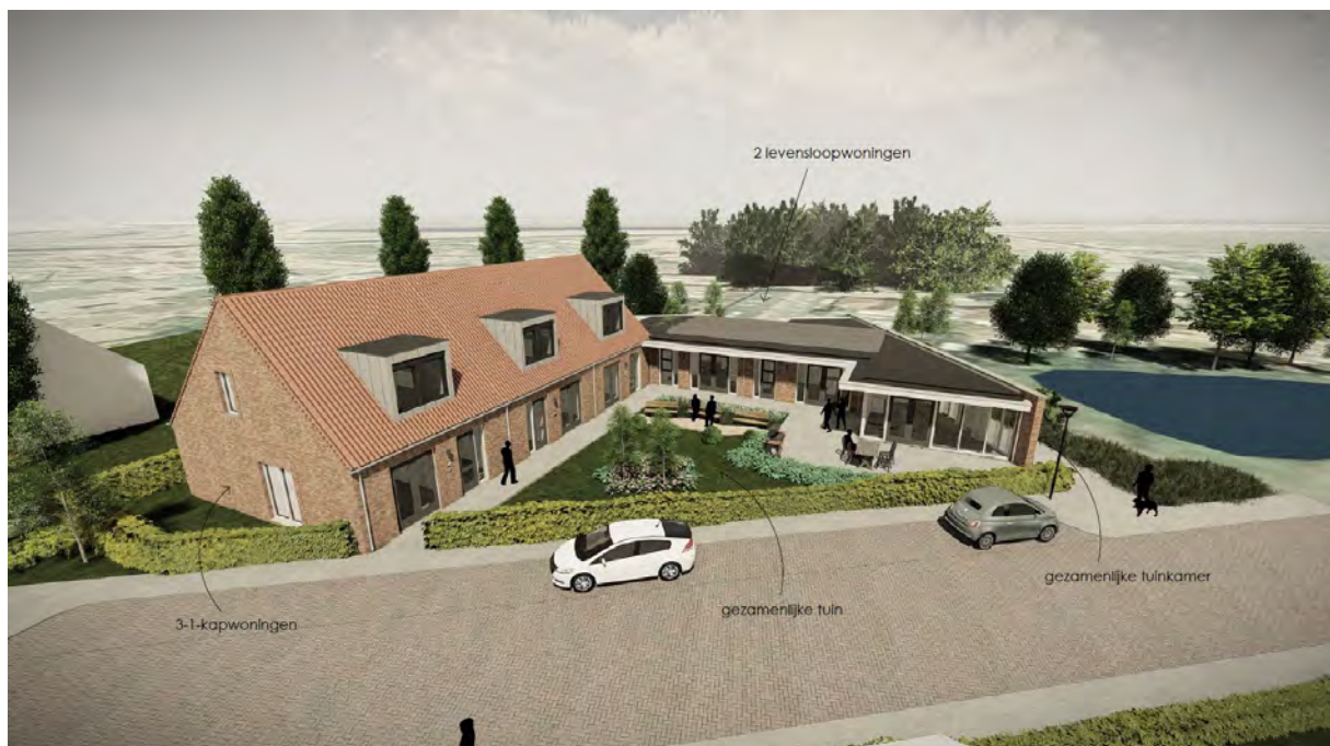
Aanzicht vanuit de Deltastraat.

Voor meer informatie, opmerkingen of vragen kunt u contact opnemen met Kadoze via kadozekattendijke@gmail.com