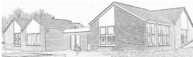
Van Heenvlietstraat 12, 4474 AT Kattendijke

Alle lezers een mooie, zonnige vakantie, toegezongen en gewenst door de alten, sopranen, tenoren en bassen van het Kattendijkse koor Katanza!