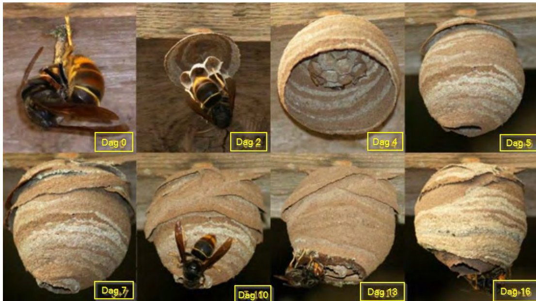
De ontwikkeling van het embryonest

skippy bal. Het volk krijgt een steeds grotere voedselbehoefte, suikers voor energie en eiwitten voor de groei van de larven (in de vorm van bijvoorbeeld honingbijen en vele andere insecten ⑤, ⑥ en ⑦). Vanaf oktober tot december vliegen de nieuwe koninginnen (tot wel 500 !) en mannetjes uit om te paren ⑧. Daarna sterft het nest uit en zoeken de koninginnen een plek om te overwinteren ⑨. Dit kan in de buurt van het oude nest zijn, maar ook tot vijftig kilometer verderop. Ongeveer 5-10% van de nieuwe koninginnen de winter. In het voorjaar begint de cyclus opnieuw.