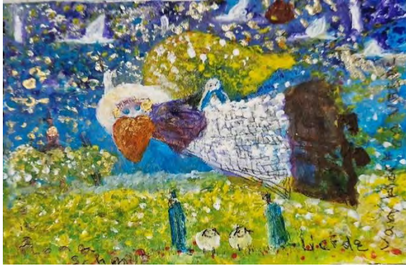
Liefde in het hart en VREDE

Schilderij 11.0 x 16.5 mm Acryl op papier 2024 Ilona Schmit