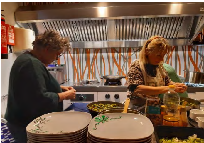
Het smulteam van Kattendijke 😊

Ook het Zwitserse menu en de winterse maaltijd was een succes.