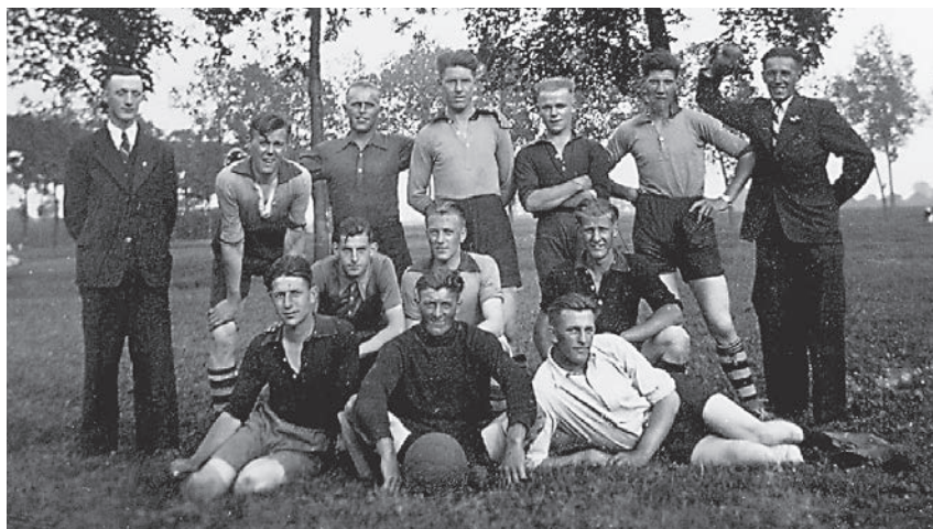
Bericht van VV Kloetinge