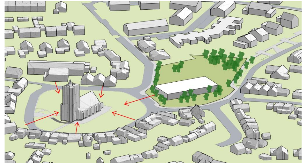
Met de gevel richting de kerk maken wij de ring rond de kerk af