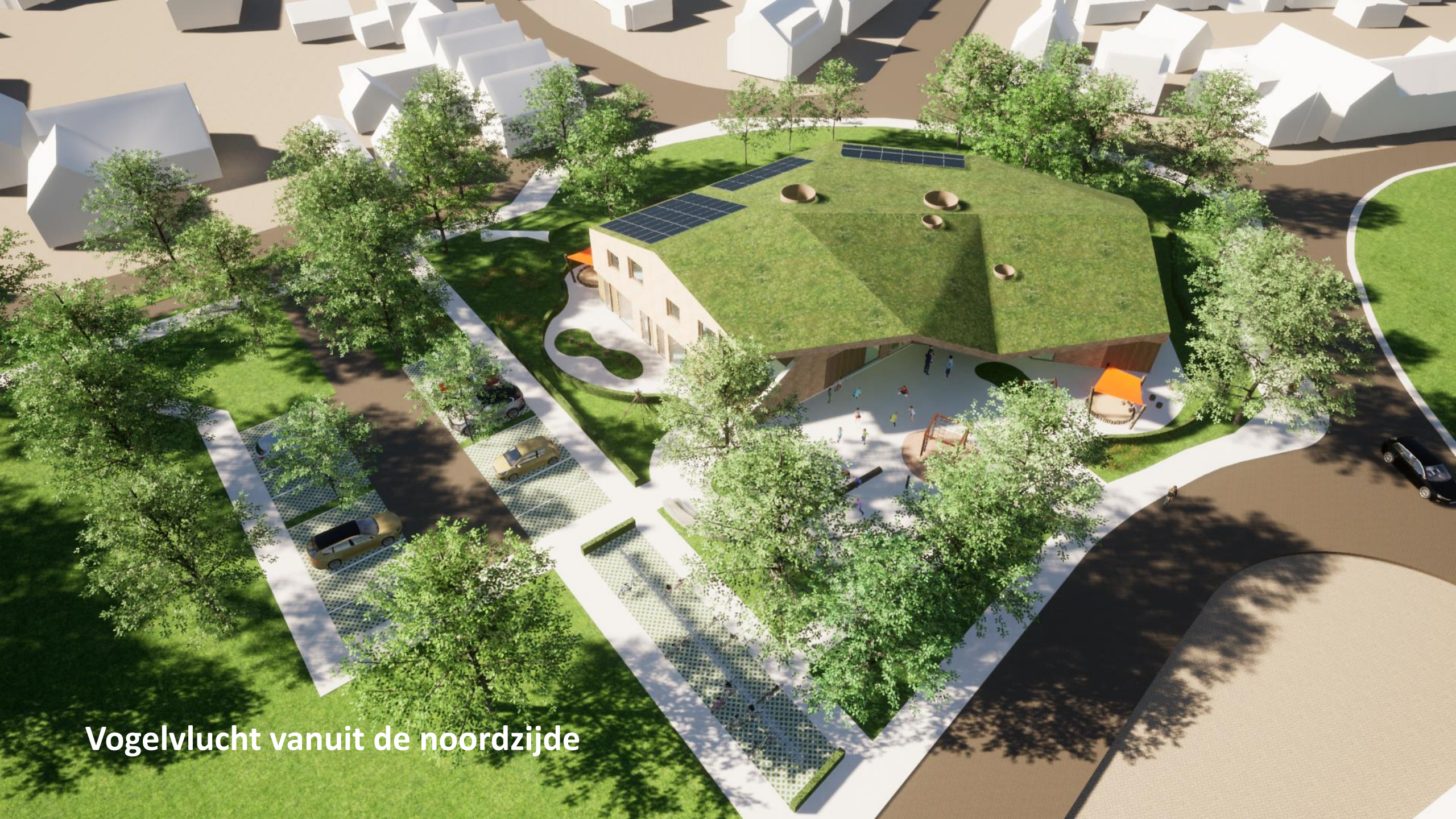
Vogelvlucht vanuit de noordzijde