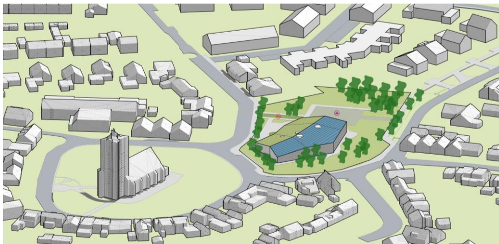
De knik op de locatie pakken wij op zodat de groene zone aan de zuidzijde gehandhaafd blijft