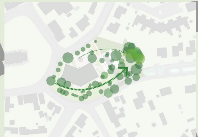
Situatie tekening / locatie inrichting (var. 1)