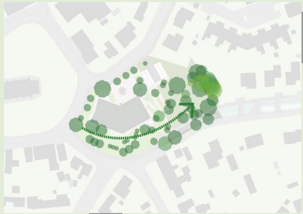
Situatie tekening / locatie inrichting (var. 2) (lang)Parkeren (10p) op terrein ontsluiting noordzijde