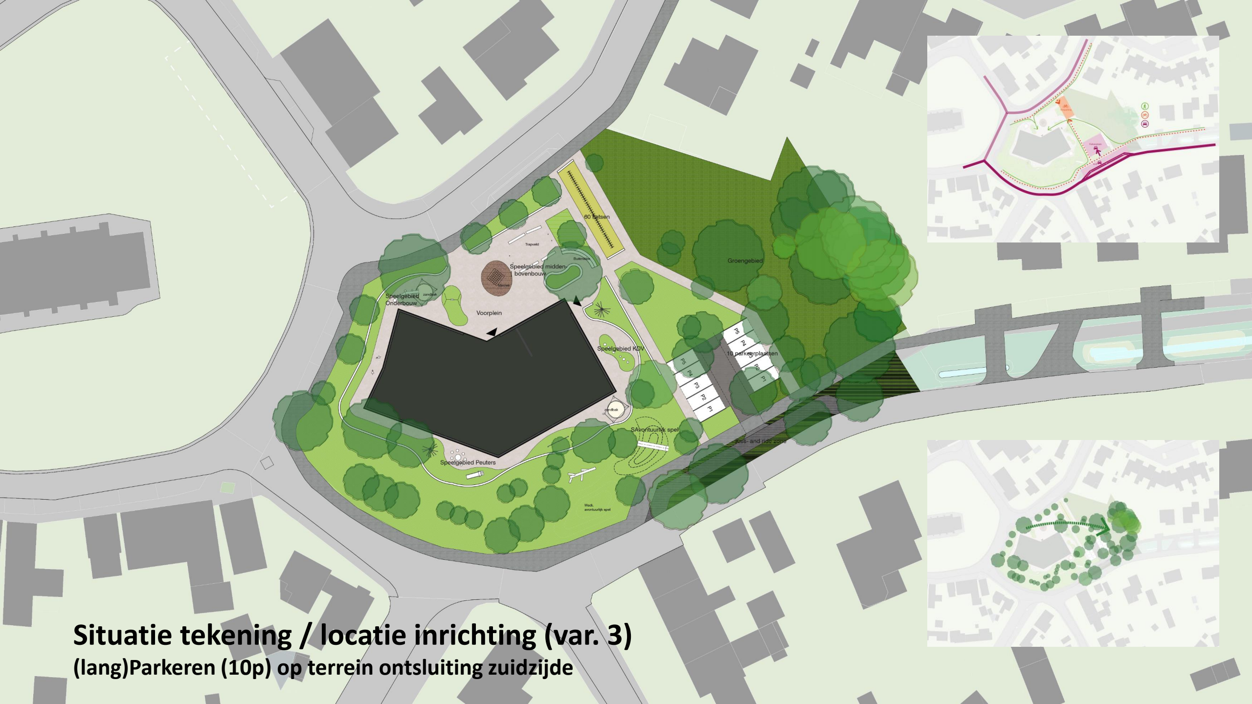
Situatie tekening / locatie inrichting (var. 3) (lang)Parkeren (10p) op terrein ontsluiting zuidzijde