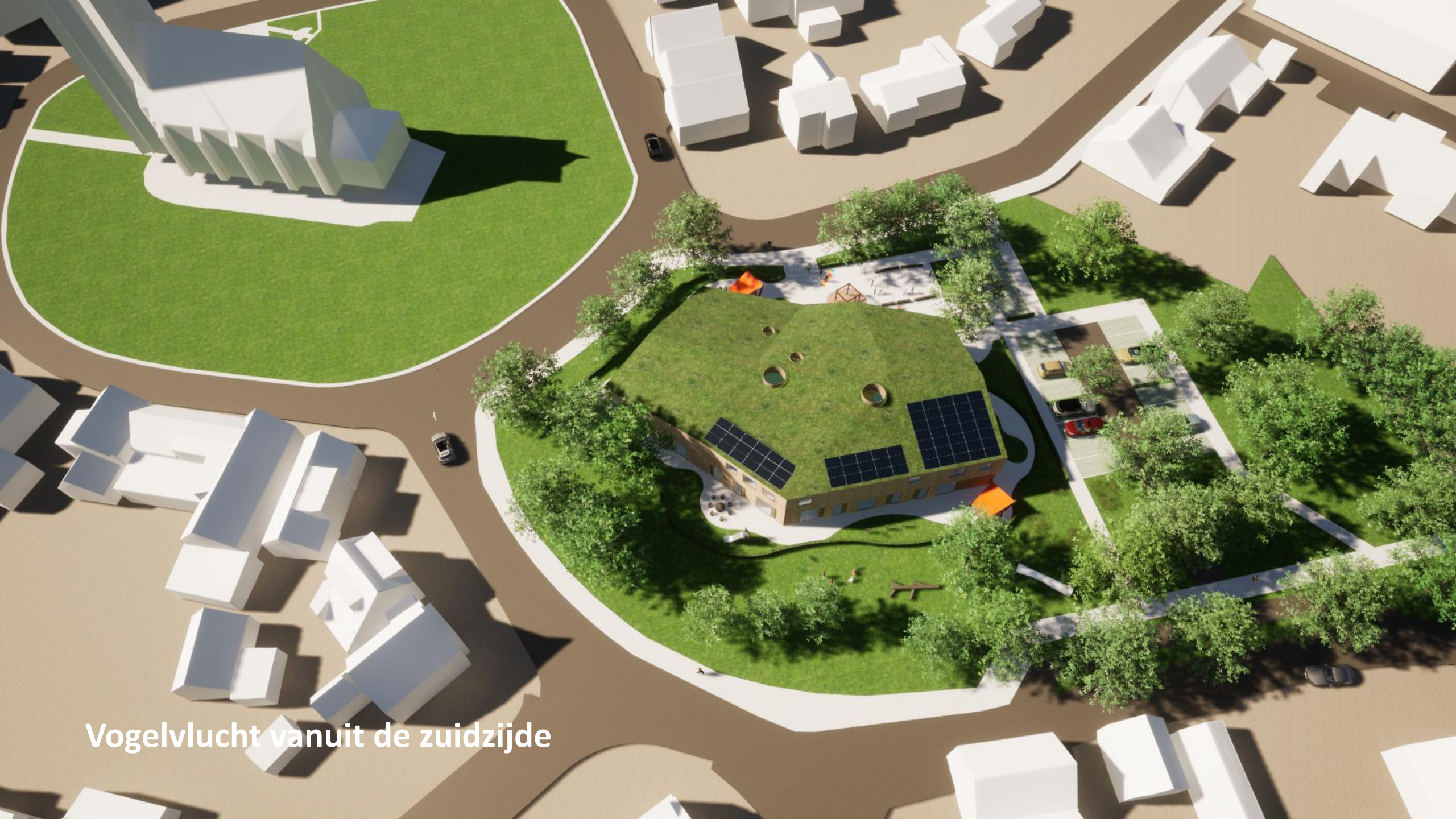
Vogelvlucht vanuit de zuidzijde