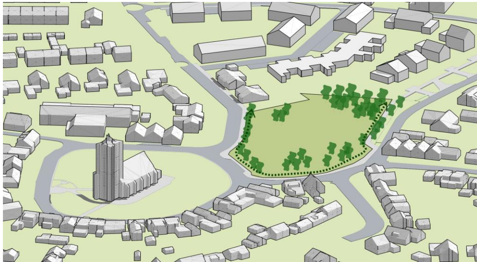
Lege locatie; behoud van de groene structuur