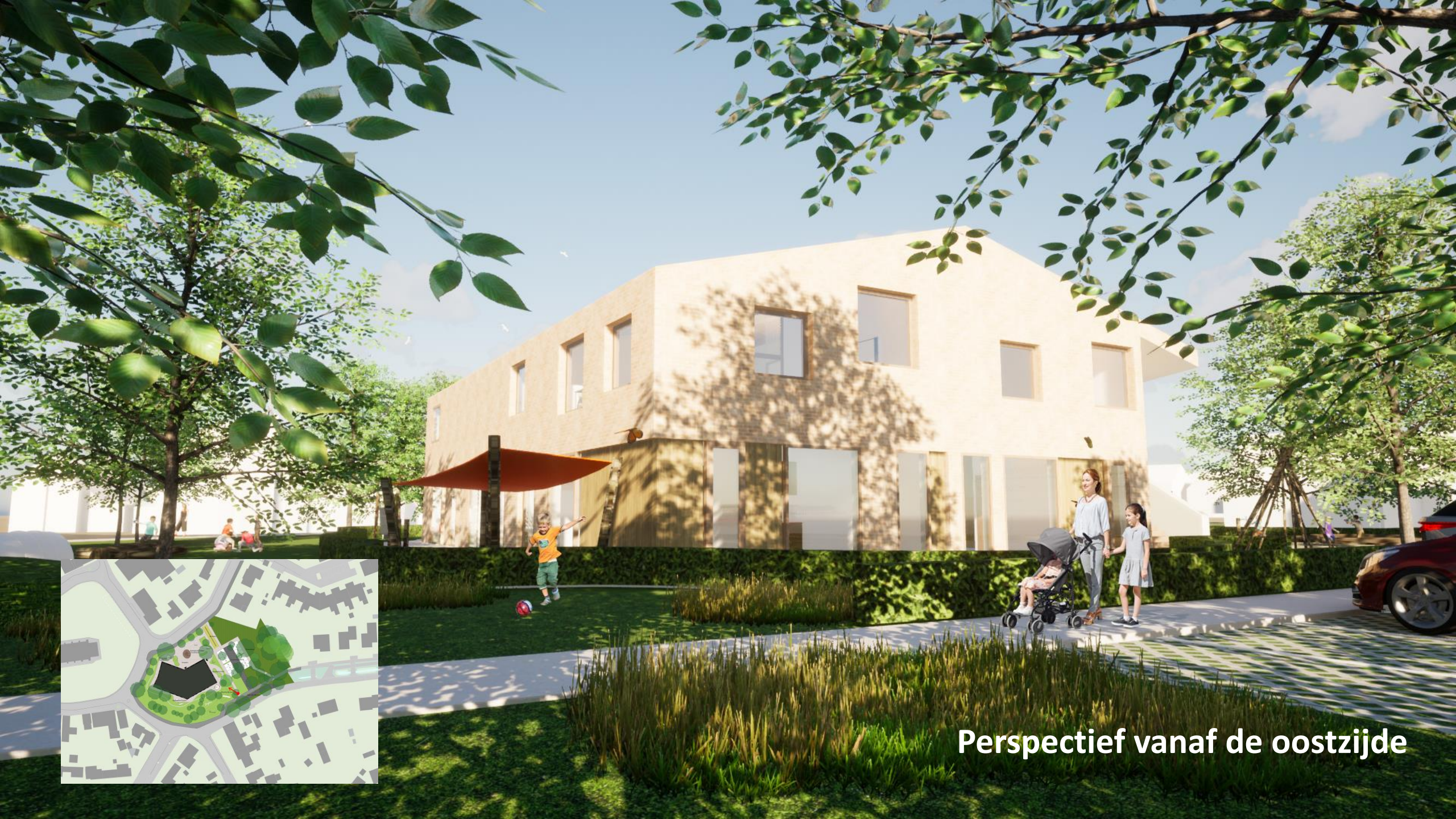
Perspectief vanaf de oostzijde