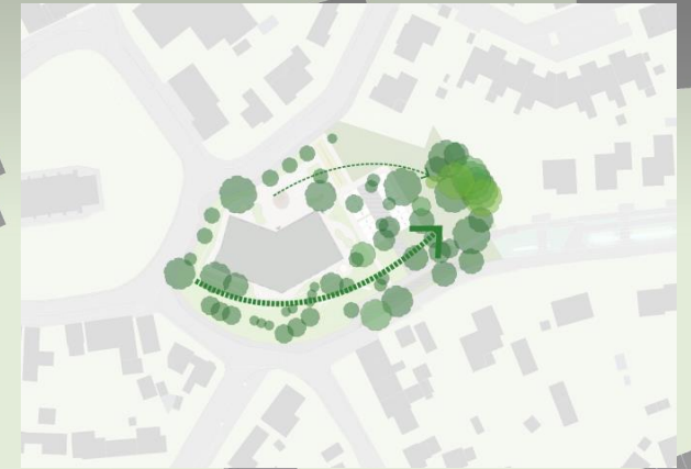
Situatie tekening / locatie inrichting (var. 1) (lang)Parkeren (16p) op terrein ontsluiting zuidzijde